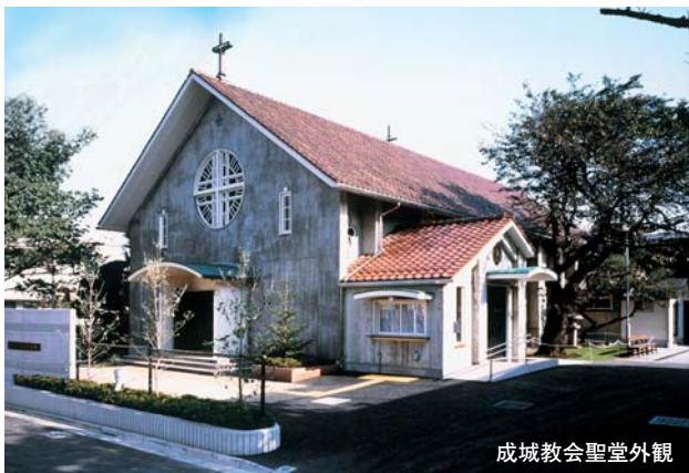
成城教会聖堂外観